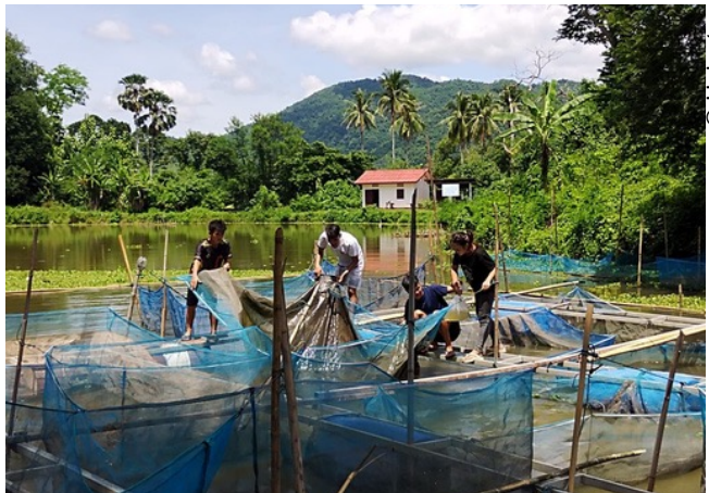
ການສ້າງຄວາມເຂັ້ມແຂງໃຫ້ໄວໜຸ່ມ ແລະ ແມ່ຍິງ ຄ່ຽງຄູ່ກັບການເສີມສ້າງທັກສະດ້ານ ເຕັກນິກ ແລະ ທຸລະກິດ ເພື່ອໃຫ້ໄວໜຸ່ມສາມາດລິເລີ່ມທຸລະກິດຂອງຕົນເອງ ແມ່ນອີກ ຮູບແບບໜຶ່ງຂອງການສົ່ງເສີມກະສິກໍາສີຂຽວ. ໃນນີ້ ໄວໜຸ່ມກຳລັງຮຽນຮູ້ເຕັກນິກການ ລ້ຽງປາລະຫວ່າງການຝຶກງານໃນ ປີ 2024 ຢູ່ແຂວງຫຼວງພະບາງ.

ເນື່ອງຈາກການນຳໃຊ້ຊັບພະຍາກອນທຳມະຊາດແບບບໍ່ຍືນຍົງ ແລະ ມີ ການໄຕ້ວາທີ່ກັນໃນທົ່ວໂລກກ່ຽວກັບການປ່ຽນ ແປງສະພາບດິນຟ້າ ອາກາດ ຈຶ່ງເປັນເຫດເຮັດໃຫ້ວຽກງານສົ່ງເສີມກະສິກໍາຢູ່ໃນ ສປປ ລາວ ຈຳເປັນຕ້ອງໄດ້ປ່ຽນແປງບຸລິມະສິດຕາມສະພາບການ. ໂຄງການ LURAS ມີສ່ວນປະກອບສຳຄັນໃນການພັດທະນາຮູບແບບ “ການສົ່ງ ເສີມກະສິກໍາສີຂຽວ” ຊຶ່ງສຸມໃສ່ການເຮັດກະສິກໍາແບບຍືນຍົງ ລວມທັງ ການດັດປັບໃຫ້ເຂົ້າກັບສະພາບການປ່ຽນແປງຂອງດິນຟ້າອາກາດ ແລະ ການຮັກສາຊີວະນາໆພັນ.